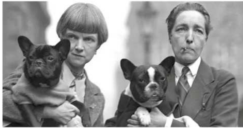
Baci-Rubati' per l'evento del 26 Novembre